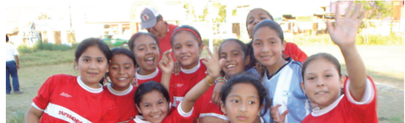
PROMOTORA SUPERCHICOS, A. B. P.